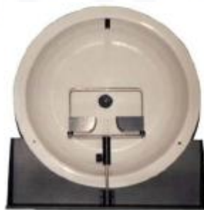
Campímetro de Cúpula